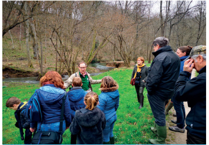
De nombreuses excursions de découverte de la rivière étaient proposées comme ici le long du Flavion à Weillen (Onhaye)