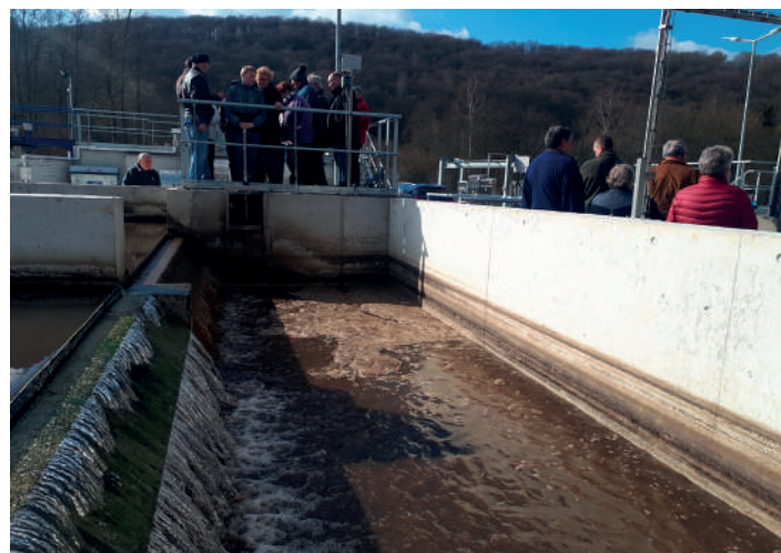
L'INASEP ouvre régulièrement les portes de ses stations d'épuration dans le cadre des Journées Wallonnes de l'Eau, comme ici à Hastière le 24 mars dernier où l'ouvrage venait d'être mis en fonction

Une dérogation à l'obligation de raccordement est possible en cas de système d'épuration individuelle en ordre de fonctionnement, préexistant à l'obligation de raccordement, ou en cas de coûts de raccordement excessifs en raison de difficultés techniques rencontrées. C'est la Commune qui délivre cette dérogation.