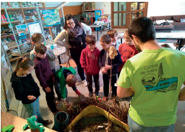
Sur initiative de la bibliothèque de Beauraing, les Contrats de rivière Lesse et Haute-Meuse se sont associés pour constituer une « mare didactique » et proposer une animation pédagogique originale à 162 élèves du primaire de l'entité