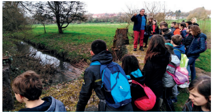
Des élèves d'Onhaye ont bénéficié d'animations sur le Flavion avec des bénévoles locaux lors des Journées Wallonnes de l'Eau 2019

Depuis que ces parcours sont opérationnels, de nombreux élèves des écoles environnantes ont pu bénéficier d'excursions encadrées par un animateur d'un des deux Contrats de rivières participant au projet ou un bénévole local très à l'aise pour nous « raconter » sa rivière... A l'heure actuelle, 380 élèves ont déjà participé à une de ces activités, provenant d'écoles de Florennes, Mettet ou bien encore Onhaye. Pour 2020, il est prévu que les écoles de Profondeville puissent aussi découvrir les attraits du Burnot.