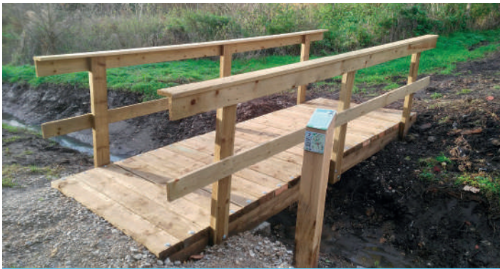
Certains aménagements ont parfois été nécessaires comme le placement d'une passerelle sur le Flavion

Les balades « Ici c'est cool... » sont donc matérialisées par des bornes sur lesquelles se trouvent des informations succinctes sur la rivière, en relation avec le contexte local (le cingle plongeur, les zones Natura 2000, les enjeux de la protection des cours d'eau, le patrimoine bâti lié à l'eau, les sources, l'eau potable...).