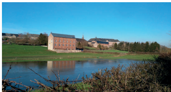
Les parcours sur le Burnot autour de l'Abbaye de Brogne (cf. photo) et sur le Flavion au centre du village ont été réalisés par le Contrat de rivière Haute-Meuse avec l'aide de partenaires locaux