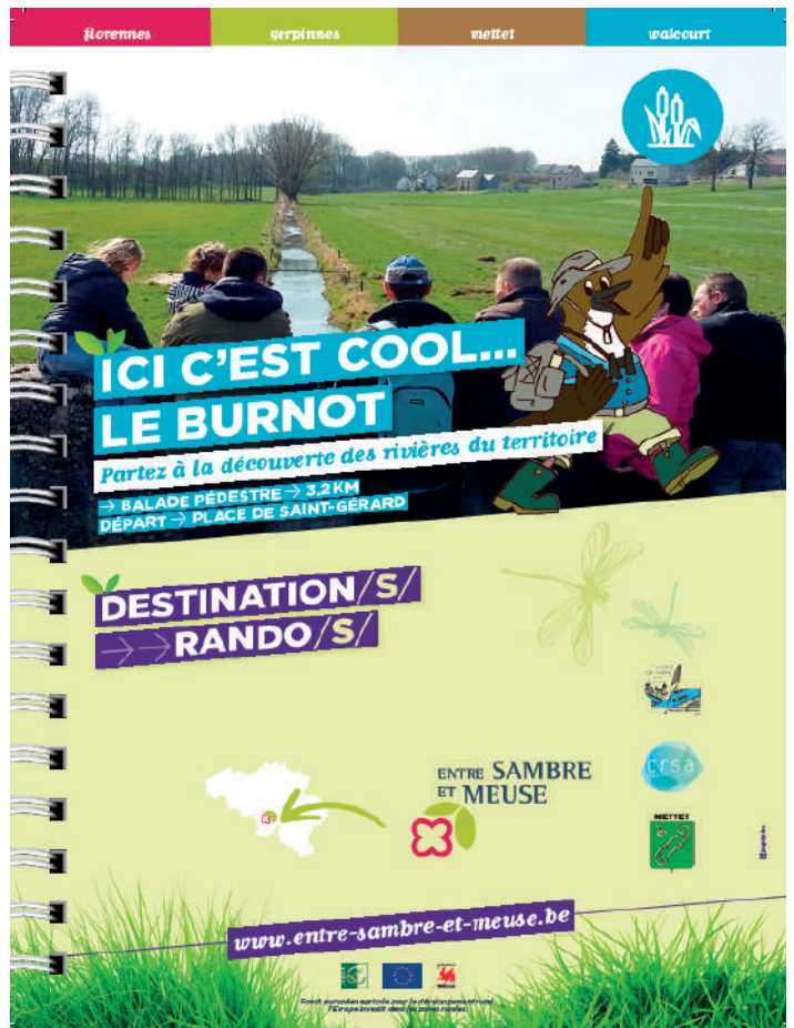
Pour chacun des parcours, un topoguide permettant de réaliser la balade en autonomie est disponible en téléchargement sur les sites internet du GAL Entre-Sambre-et-Meuse et des Contrats de rivière. Ils sont aussi disponibles sur demande en version papier.

Plusieurs balades guidées ont également été réalisées pour le grand public. Les prochains mois vont être mis à profit pour continuer à faire connaître ces parcours et les pérenniser par une appropriation locale. D'autres écoles vont bénéficier de cet outil didactique et de nouvelles balades guidées seront programmées.