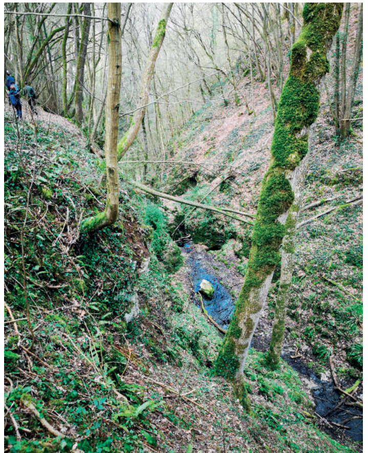
La découverte du ravin du Colébi à Falmignoul (Dinant) a connu un franc succès avec pas moins de 49 personnes présentes