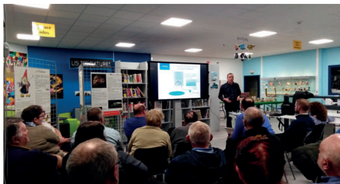
Présentation par l'INASEP de la nouvelle législation sur l'épuration autonome : démarches et obligations des citoyens, primes disponibles et différents systèmes possibles. De nombreux riverains concernés des communes de Florennes et Mettet étaient présents à la bibliothèque communale de Florennes pour cette activité proposée lors des Journées Wallonnes de l'Eau le 21 mars 2019.

Pour les anciennes habitations, aucune imposition n'est prévue, sauf dans deux cas. Premièrement, si l'habitation se trouve dans une zone prioritaire. Il faut alors se référer à l'arrêté ministériel de l'étude de zone afin de connaître les obligations en termes d'épuration qui sont imposées pour l'habitation en question, ainsi que les délais de mise en conformité qui y ont été prévus. Ces informations peuvent être obtenues auprès de l'administration communale. Deuxièmement, si l'évacuation des eaux usées entraîne un trouble à la salubrité publique. La Commune peut alors, en vertu de son pouvoir de police administrative générale et des nouvelles dispositions du code l'Eau (art. R280), prendre des mesures pour mettre fin au trouble. Parmi ces mesures, figure la possibilité, pour la Commune, d'imposer l'installation d'un système d'épuration individuelle.