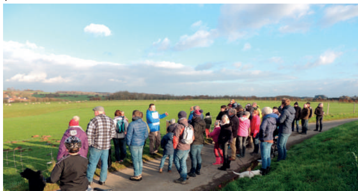
Afin de répondre aux souhaits des citoyens, quatre parcours didactiques autour de la rivière ont vu le jour entre mars 2018 et mars 2019

Lors de l'inauguration des parcours pendant les Journées Wallonnes de l'Eau 2018 et 2019 et pendant le festival 100% Rural, les participants ont pu bénéficier d'explications complémentaires sur le fonctionnement d'une station d'épuration et ont pu repartir chez eux avec quelques échantillons de produits d'entretien écologiques réalisés sur place.