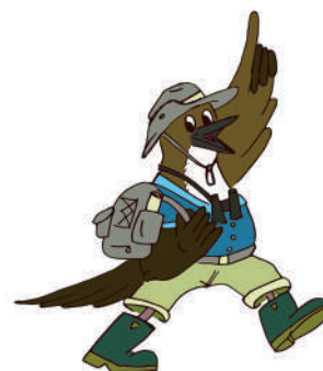
Le cingle plongeur : emblème des parcours « Ici c'est cool... »

La construction de ces parcours s'est voulue participative. En consultant les locaux, les personnes ressources et l'Administration communale afin d'identifier les éventuels aménagements nécessaires, nous avons défini une ligne directrice : un parcours de plusieurs kilomètres permettant d'observer la rivière et son environnement, une signalétique didactique et un topoguide permettant au promeneur de réaliser la balade en autonomie.