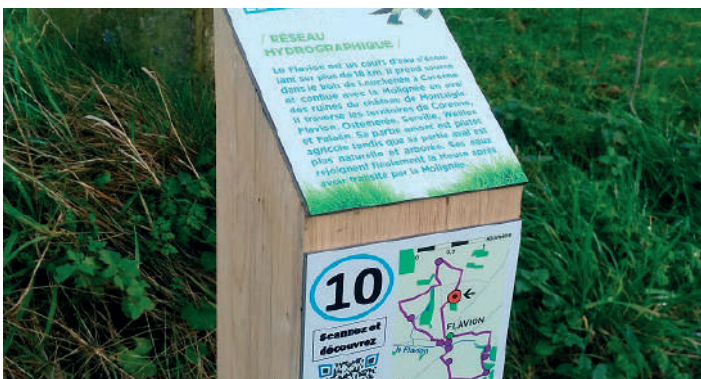
Une dizaine de bornes informatives sur la rivière ont été installées sur chacun des 4 parcours « Ici c'est cool... ». Elles redirigent le promeneur vers une information plus complète disponible en ligne.

Les balades « Ici c'est cool... » sont donc matérialisées par des bornes sur lesquelles se trouvent des informations succinctes sur la rivière, en relation avec le contexte local (le cingle plongeur, les zones Natura 2000, les enjeux de la protection des cours d'eau, le patrimoine bâti lié à l'eau, les sources, l'eau potable...).