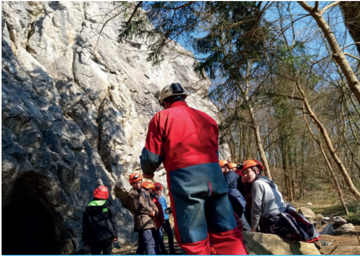
Aux Grottes de Goyet, 221 élèves des écoles de Gesves, Ohéy et Assesse ont pu bénéficier d'activités de sensibilisation au karst et au cycle de l'eau avec l'asbl Spéléo-J

Cette nouvelle édition des Journées Wallonnes de l'Eau a été un réel succès tant pour les activités grand public que pour les animations pédagogiques proposées aux écoles. Cet événement mis sur pied en seconde quinzaine de mars de chaque année par l'ensemble des Contrats de rivière wallons constitue donc au fil des années un événement reconnu. A notre échelle, si l'on retient les chiffres des 3 dernières éditions (2017-2019), ce ne sont pas moins de 5986 élèves et 2065 citoyens qui ont pris part à une activité sur le territoire du Contrat de rivière Haute-Meuse. Une nouvelle fois, nous tenons à remercier l'ensemble de nos partenaires sans qui ces journées de sensibilisation n'auraient pas la dimension qu'elles ont actuellement.