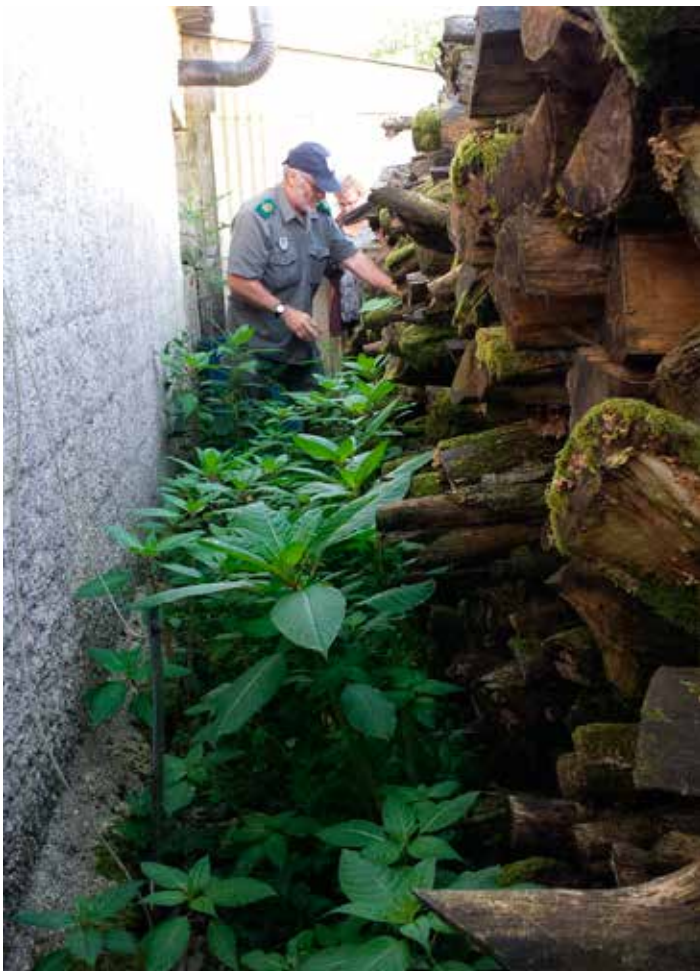
Les moindres recoins humides du jardin sont mis à profit par la balsamine de l'Himalaya pour se développer (Taillette, commune française située sur la partie amont du bassin versant de l'Eau Noire)

Cette plante d'ornement apprécie les sols frais et humides de nos cours d'eau et s'est donc en quelque sorte, « échappée » de nos jardins pour coloniser progressivement les berges et plaines alluviales des ruisseaux et rivières en lieu et place de nos plantes indigènes.