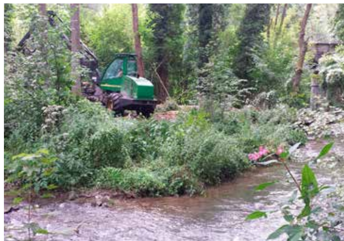
Si les riverains disposant de balsamines de l'Himalaya dans leurs jardins sont le plus souvent à l'origine de sa dispersion dans notre environnement, la présence de sangliers et le transport de terres par les machines lors de travaux forestiers peuvent aussi contribuer à la dissémination de la plante invasive (Le Bocq en amont de Bauche, août 2016).

Les inventaires réalisés le long des cours d'eau par la Cellule de coordination du CRHM facilitent la détection des nouvelles populations de balsamines de l'Himalaya et permettent d'agir avant que l'invasion ne soit trop importante. Les bénévoles (pêcheurs, naturalistes...) jouent également leur rôle de sentinelle. A ce titre, ces dernières années, plusieurs dizaines de riverains qui possédaient des balsamines de l'Himalaya à titre ornemental dans leur jardin ont été informés de la problématique et ont été invités à les enlever de leur propriété. Il s'agissait là d'une des clés de la réussite de ce projet. Pour les remercier de leur contribution, des sachets de graines de plantes indigènes des milieux humides qui pouvaient être semées après que les balsamines aient été enlevées leur ont été remis.