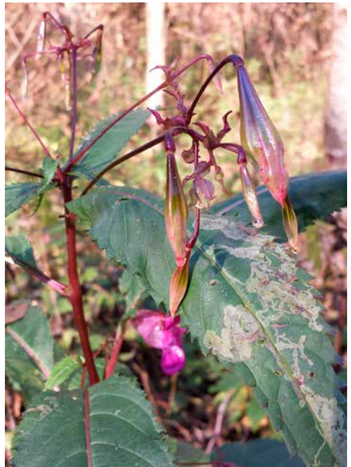
L'arrière-saison a particulièrement été douce en 2015 avec des fleurs et capsules viables de balsamines de l'Himalaya observées très tardivement (le ruisseau de Massemble à Feschaux sur la commune de Beauraing, le 02 novembre 2015)

La gestion commence en juillet avant la formation des graines (les capsules les contenant arrivent à maturité en août). Un deuxième passage en août et un troisième passage en septembre permettent d'éliminer les repousses et les plants oubliés. Ce mode opératoire est ensuite reconduit quelques années jusqu'à disparition complète de la banque de graines présente dans le sol.