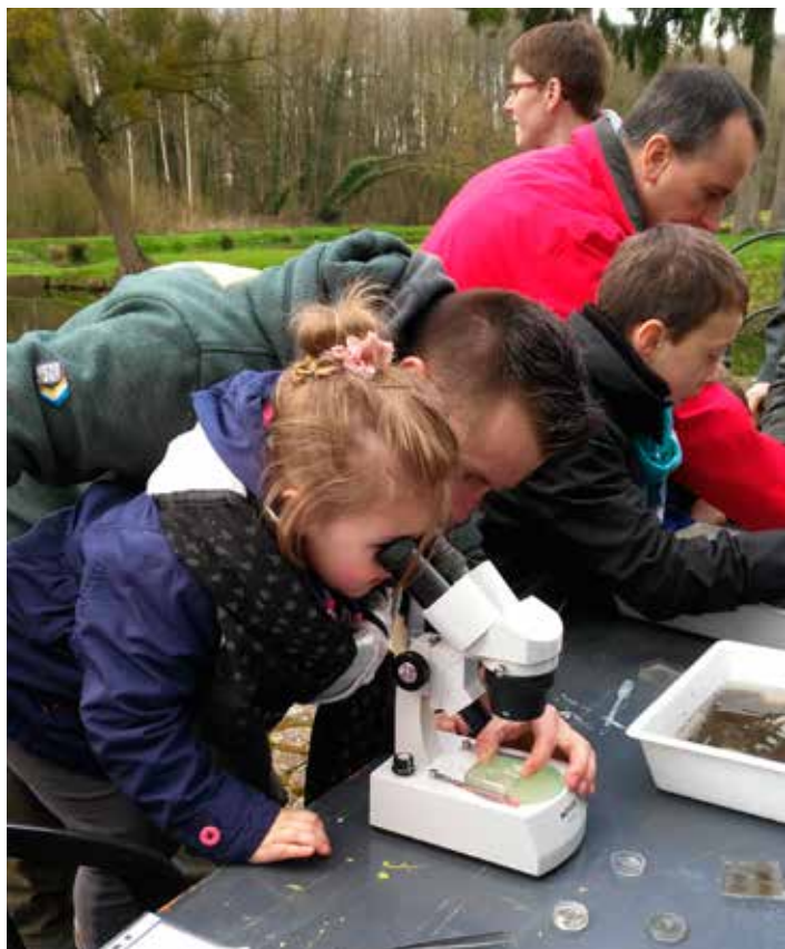
Un événement de lancement du GAL Entre-Sambre-et-Meuse s'est tenu le weekend du 16 et 17 avril au château d'Acoz. Les Cellules de coordination du CRHM et du CR Sambre y proposaient une exposition et un atelier de découverte des macro-invertébrés en rivière.

Pour arriver à ces objectifs, un partenariat a été établi entre les Contrats de rivière Haute-Meuse et Sambre & Affluents et les partenaires « agricoles » (PhytEauWal, NitraWal, Natagriwal, Centre wallon de Recherches agronomiques...).