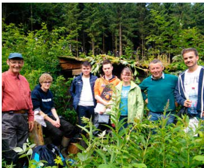
Des bénévoles sont venus renforcer les actions menées par la Cellule de coordination et les étudiants du CRHM dans le bassin du Bocq, de l'Eau Noire et de la Houille, comme ici à Louette-Saint-Denis (commune de Gedinne) à proximité du ruisseau de Fontenelle.

Les efforts les plus importants ont été déployés sur les cours d'eau des bassins versants du Bocq (Ciney, Hamois, Yvoir), de l'Eau Noire et de l'Eau Blanche (Chimay, Couvin), du ruisseau de Massembre (Beauraing, Hastière) et de la Houille (Gedinne) où les plants ont été arrachés par milliers.