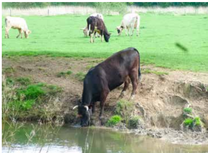
Une pratique interdite depuis le 1er janvier 2015 sur de nombreux cours d'eau

Faisant suite au nouvel Arrêté du Gouvernement wallon relatif à l'obligation de clôturer les pâtures sur certains cours d'eau, la Cellule de coordination a proposé tout au long de l'année 2014 un soutien aux agriculteurs des communes partenaires du CRHM. Cette aide s'est traduite par des conseils techniques et un soutien dans les démarches d'obtention des subsides accordés par la Wallonie pour la pose de clôtures et systèmes d'abreuvement alternatifs (visite de parcelles, aide au choix des matériaux, devis estimatif, introduction de la demande de subvention via Internet...)