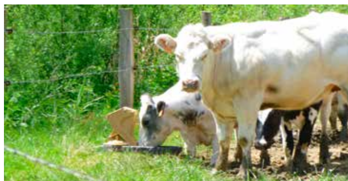
La pompe à museau est une alternative efficace à l'abreuvement direct du bétail au cours d'eau

Il faut aussi tenir compte du projet LIFE WALPHY et des aménagements financés et réalisés entre 2012 et 2014 par le projet « coopération berges » (projet mené par les GAL « Saveurs et patrimoine », « Pays des Condruses » et « Tiges et chavées »), avant la mise en place de la subvention. 13 communes étaient concernées dont 5 en Haute-Meuse (Assesse, Ciney, Hamois, Gesves et Ohey) ; ce qui représente 10,5km de berges, 33 pompes à museaux et 7 bacs pour ces 5 communes.