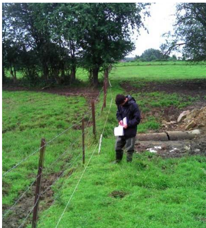
L'inventaire des atteintes aux cours d'eau (rejets d'eaux usées, érosions des berges par le bétail, déchets sauvages, plantes invasives...) constitue une des missions demandées aux Contrats de rivière

Cette demi-journée de rencontre a ainsi permis de faire le point sur le rôle des pouvoirs locaux dans les Contrats de rivière et sur les collaborations nombreuses existantes, mais aussi d'envisager des pistes à développer. Elle démontre aussi que la Province de Namur s'inscrit dans la philosophie de base des Contrats de rivière : des projets basés sur une forte participation des structures locales dans le but de favoriser une gestion intégrée des ressources en eau et la participation citoyenne qui en découle.