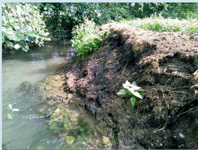
Exemple d'atteinte au cours d'eau infractionnelle