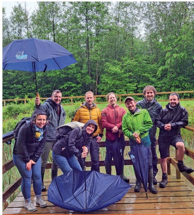
L'équipe du Contrat de rivière Haute-Meuse s'est agrandie avec un nouveau chargé de mission inondation

L'animation des 14 Comités Techniques par Sous-Bassin Hydrographique (CTSBBH) qui couvrent l'ensemble du territoire wallon a également été confiée aux 14 Contrats de rivière de Wallonie par la Direction des Cours d'eau non navigables (DCENN) du SPW. Ils viennent de se dérouler (voir page suivante).