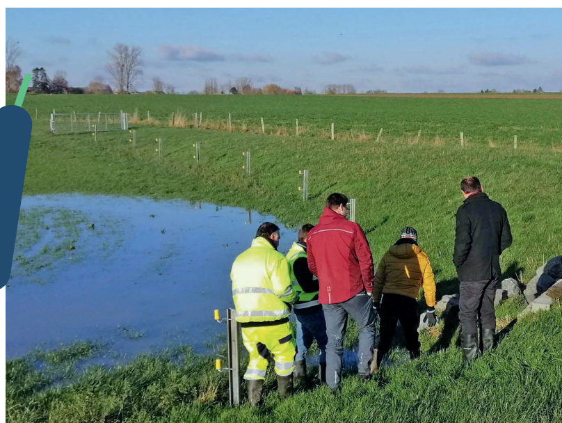
Exemple d'une zone d'immersion temporaire (ZIT) créée par la Commune de La Bruyère pour contenir des axes de ruissellement responsables d'inondations d'un quartier d'habitations.

Ce 30 novembre, le Gouvernement wallon a notifié son accord sur le projet de « Convention de coopération horizontale entre la Région wallonne et les Contrats de rivière de Wallonie pour favoriser le développement de la culture du risque d'inondation et de projets visant à améliorer la résilience du territoire face aux inondations ». Cette convention vient tout juste d'être signée fin décembre pour une durée d'un an, renouvelable 3 fois.