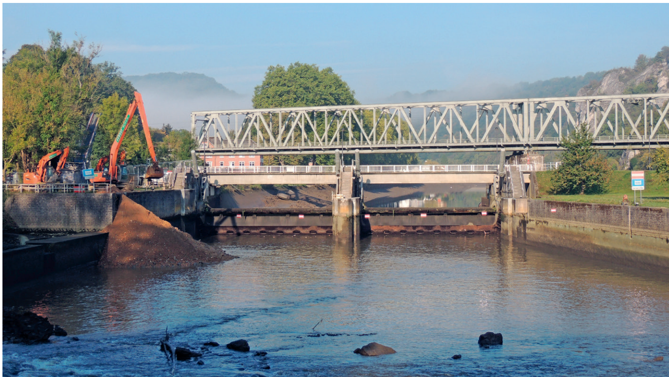
Travaux coordonnés par le SPW-Direction des Voies hydrauliques de Namur au barrage éclusé d'Anseremme lors de la dernière mise en chômage, en 2017

Du 24 septembre au 16 octobre inclus, la Meuse sera mise en chômage entre la frontière française et le barrage de La Plante, à Namur. Durant ces 3 semaines, la navigation y sera interrompue, et l'amarrage, interdit. Une opération spectaculaire et nécessaire.