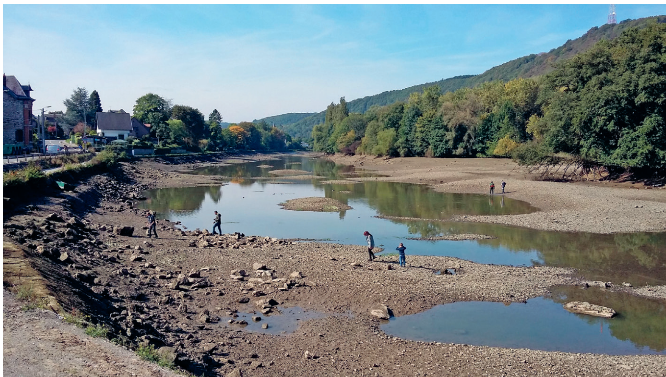
La passe droite des îles de Godinne lors du dernier chômage de la Haute-Meuse, en 2017