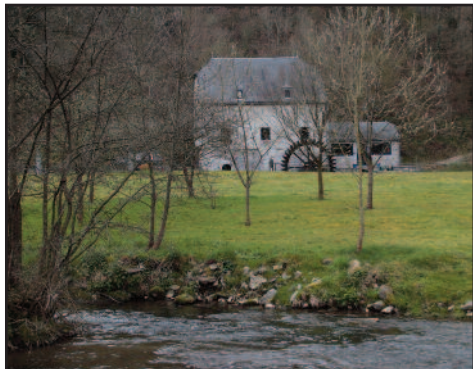
Moulin de Bauche (le long du Bocq) dont la grande roue, aujourd'hui rénovée actionnait une forge.