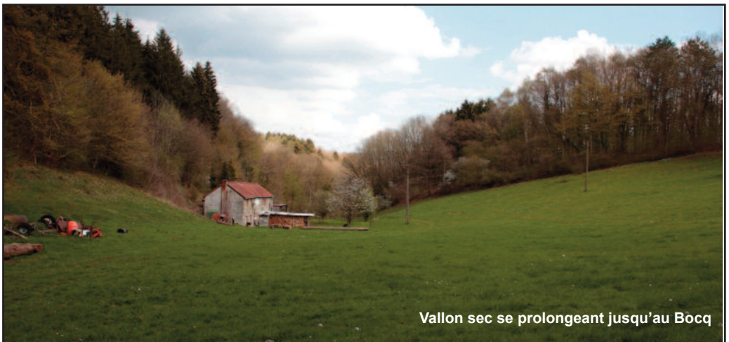
Vallon sec se prolongeant jusqu'au Bocq

Il faut s'imaginer que ce profond vallon dont le sommet des versants culmine 50m au-dessus de son fond a sec a été creusé par le passé par un cours d'eau aujourd'hui disparu. Les débits devaient être violents durant le quaternaire pour permettre une érosion aussi forte.