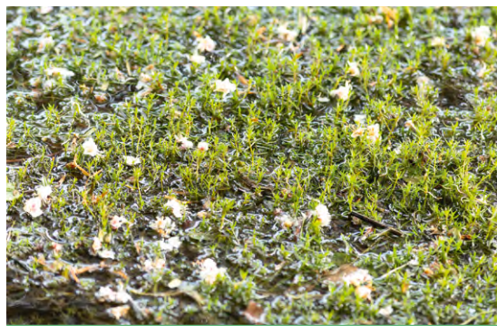
Crassule des étangs